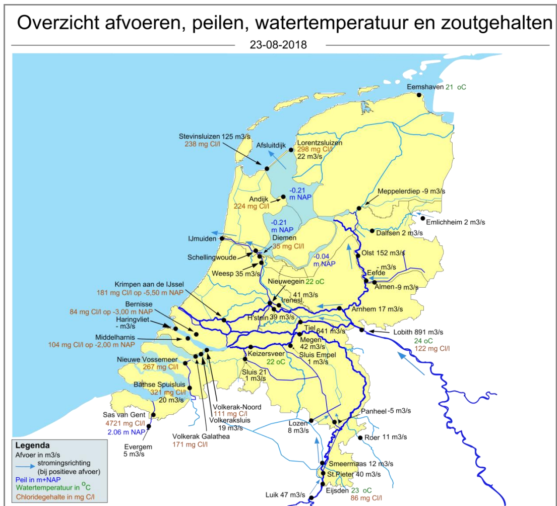
Figuur 3. Landelijk overzicht met metingen van stroomrichting, afvoer, waterpeil, watertemperatuur en zoutgehaltes op diverse locaties.

Het volgende droogtebericht verschijnt op donderdag 30 augustus 2018.