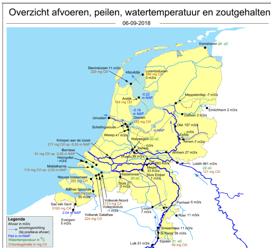
Figuur 3. Landelijk overzicht met metingen van stroomrichting, afvoer, waterpeil, watertemperatuur en zoutgehalten op diverse locaties.

Het volgende droogtebericht verschijnt op donderdag 13 september 2018.